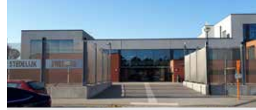
Zuinig met energie en belastinggeld p. 3