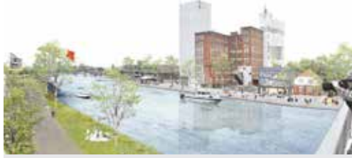
Plan houdt Geel gezellig en groen p. 2