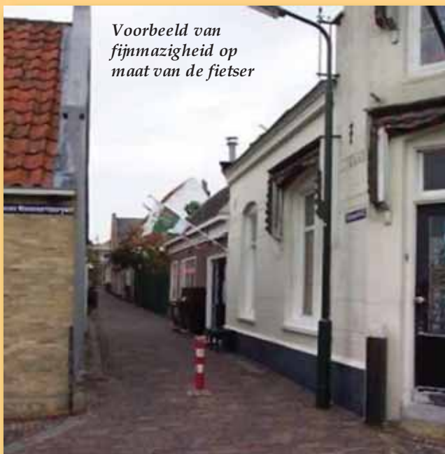
Voorbeeld van fijnmazigheid op maat van de fietser

Ecomobiliteit is meer dan het plaatsen van enkele fietsstallingen. Gezonde, duurzame en veilige mobiliteit is gebaseerd op het handhaven van een stedelijk groenbeleid binnen de stadskern, het invoeren van een fijnmazig fiets- en voetgangersnetwerk (in samenwerking met vzw Trage Wegen) en dit dan vanzelfsprekend gekoppeld aan het doorvoeren van een lokaal "stegenplan" met een fietscompensatiebeleid.