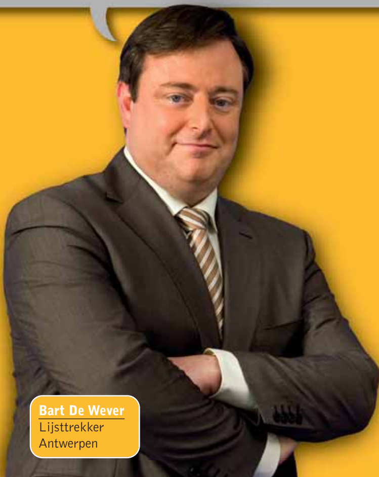
Bart De Wever Lijsttrekker Antwerpen

“De crisis oplossen, dat kunnen we niet in een-twee-drie. Maar met een sterker Vlaanderen kunnen we ze wél veel beter opvangen.”